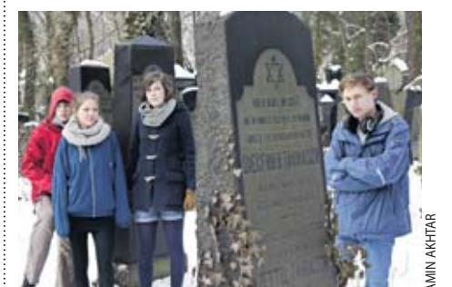
Projekt Schüler der Theresienschule auf dem Jüdischen Friedhof Weißensee

➤ „Verschwundene Nachbarn“, bis 12. April, tgl. 8–20 Uhr, Katholische Akademie, Hannoverstraße 5